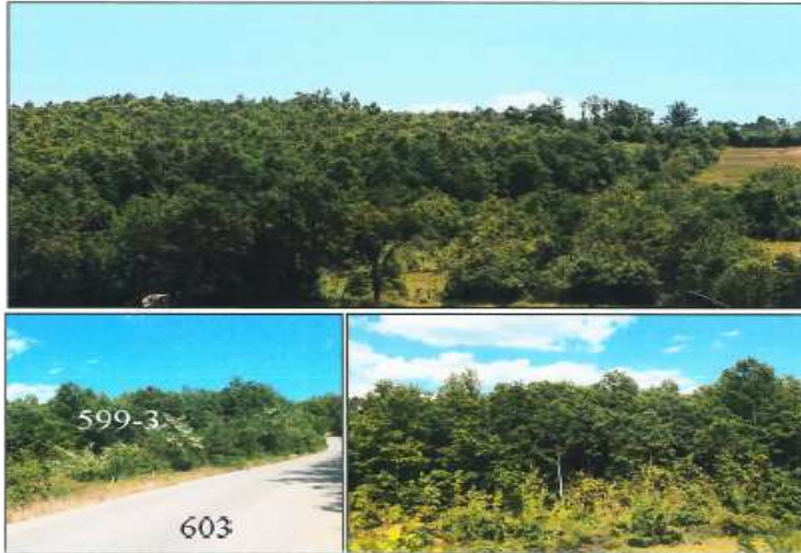
Pamje e parcelave nr.599-2 dhe 599-3 z.k Kaliqan,Istog

Fotografitë e mëposhtme prezantojnë gjendjen faktike të parcelave nr.599-2 dhe 599-3 z.k Kaliqan: