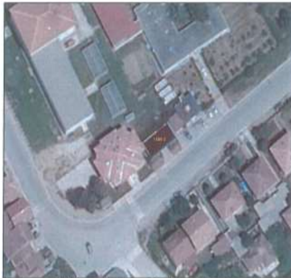
Ortofoto „pozicioni i dyqanit në kuadër të parcelës

Sipërfaqja është prezantuar në detaje në skicën e matjeve të përgatitur enkas për këtë aset.