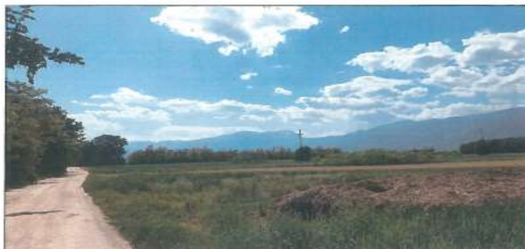
Đamja e parcelës nr.280-1 z.k Đubravë, istog

Fotografia e mëposhtme prezanton gjendjen faktike të parcelës nr.280-1 z.k Đubravë: