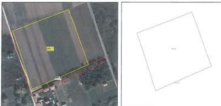
Ortofoto dhe kopja e planit për parcelën nr.280-1 z.k Dubravë, Istog

Parcela sipas certifikatës së pronësisë evidentohet në emër të KB Dubrava, me sipërfaqe prej 27941m 2 (2 hektar 79 ari dhe 41 m 2 ) me kulturë : pyjor, tokat pyjore, mal i klasës 2.