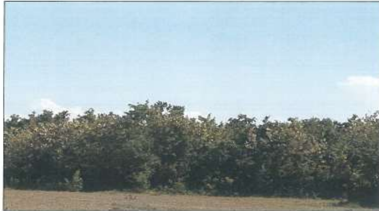
Pamje nga larg e parcelës nr.261-5 z.k Dubravë, Istog

Fotografia e mëposhtme prezanton gjendjen faktike të parcelës nr.261-5 z.k Dubravë: