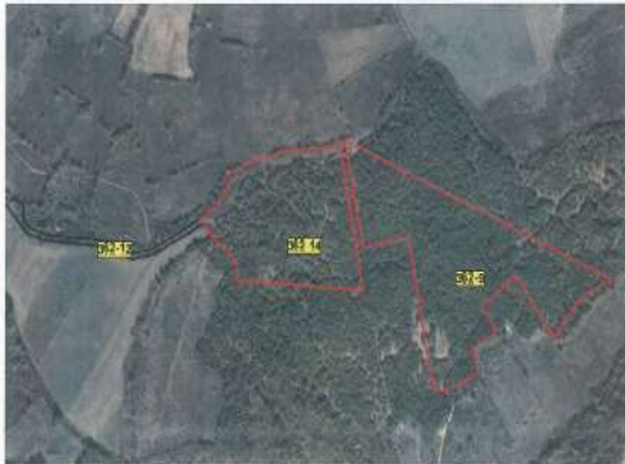
Fig.1 Ortofoto, parcelat kadastrale 362-9 & 362-14

Toka është e regjistruar në certifikatën e pronësisë me numër të njësisë P-71006004-362-9 me sipërfaqe prej 25800 m 2 me kulturë Mal i klasës 3, P-71006004-362-14 me sipërfaqe prej 18080m 2 me kulturë Mal i klasës 3, sipërfaqja e përgjithshme e tyre është 43880 m 2 Z.K Berkovë.