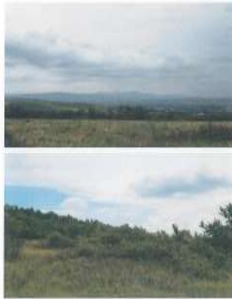
Fig.2. Fotografitë e terrenit