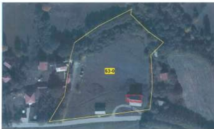
Ortofoto - Objekti (Mulliri) në z.k Brezhanik, Komuna e Pejës

Objekti shtrihet në parcelën nr.63 z.k Brezhanik, parcelë kjo që figuron në emër të "PSH E Mirë e Fshatit".