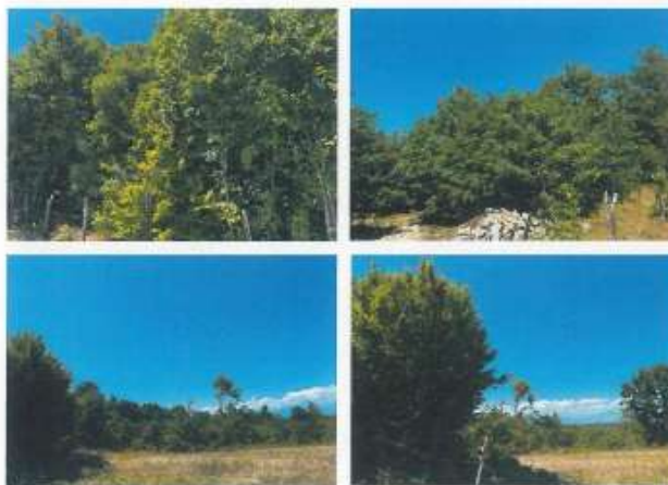
Fig. 2 Fotografitë e terrenit, parcela kadastrale bazë me nr të njësisë 864-0

Blerta Jashari Kastrati Zyrtarë Kadastrale