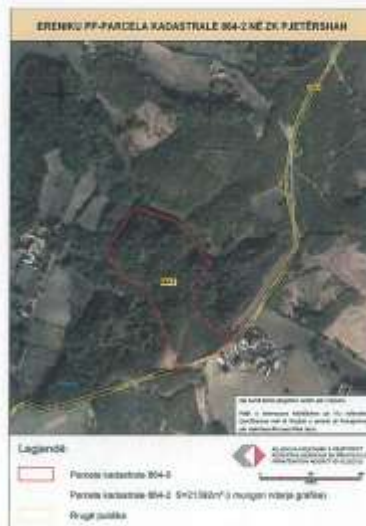
Fig.1 Ortofoto, parcela kadastrale bazë me nr të njësisë 864-0

Toka është e regjistruar në certifikatën e pronësisë, parcela kadastrale me nr të njësisë P-70705057-00864-2 me sipërfaqe prej 21392m 2 me kulturë Mal i klasës 5.