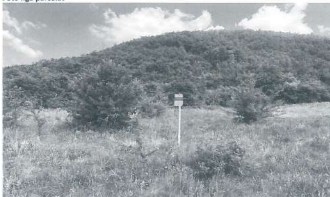
Foto nga parcelat

AGJENCIA KOSOVARE E PRIVATIZIMIT KOSOVSKA AGENCIJA ZA PRIVATIZACIJU PRIVATISATION AGENCY OF KOSOVO