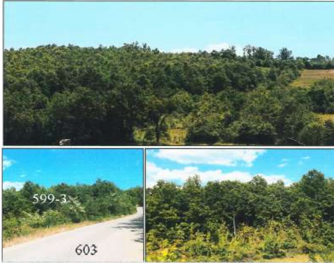
Pamje e parcelave nr.599-2 dhe 599-3 z.k Kaliqan, Istog

Fotografitë e mëposhtme prezantojnë gjendjen faktike të parcelave nr.599-2 dhe 599-3 z.k Kaliqan: