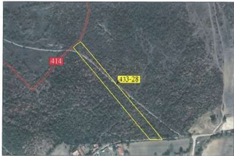
Ortofoto për parcelën nr. 433-28 z.k Dranashiq, Klinë.

Parcela sipas certifikatës së pronësisë evidentohet në emër të NPB Malishgan. Sipërfaqja e përgjithshme e parcelës nr.433-28 është 5401 m 2 (54 ari dhe 1m 2 ), me kulturë: pyjor-mal i klasës 3.