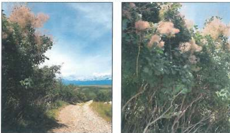
Fotografie e parcelës nr.433-28 z.k Dranashiq, Klinë

Fotografitë e mëposhtme prezantojnë gjendjen e parcelës në z.k Dranashiq: