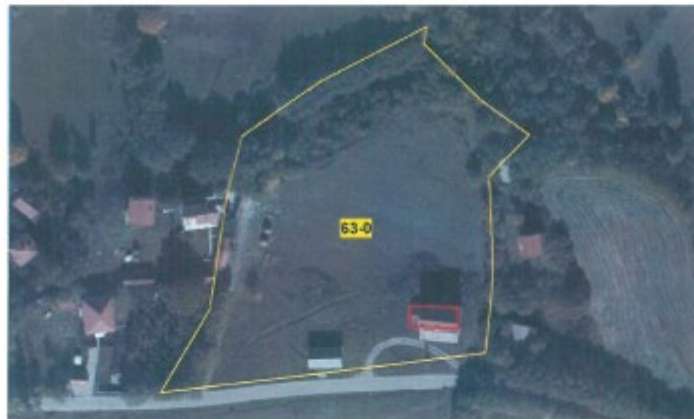
Ërtofoto - Objekt (Mulliri) në z.k Brezhenik, Komuna e Pejës

Objekti shtrihet në parcelën nr.63 z.k Brezhenik, parcelë kjo që figuron në emër të "PSH E Mirë e Fshatit".