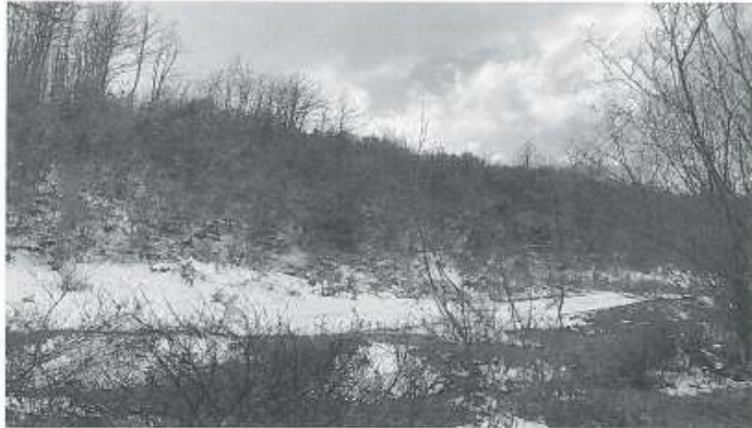
Foto nr.1 Parcela nr.356-0,kullosë me shkurre dhe drunjë të rinjë.

AGJENCIA KOSOVARE E PRIVATIZIMIT KOSOVSKA AGENCIJA ZA PRIVATIZACIJU PRIVATISATION AGENCY OF KOSOVO