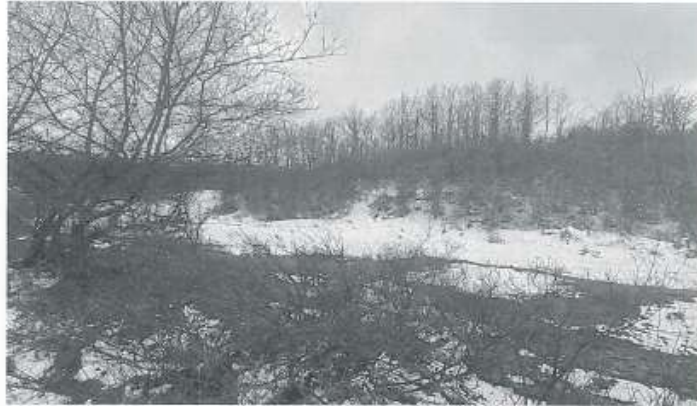
Foto nr.2 Parcela nr.795-0 me shkurre

AGJENCIA KOSOVARE E PRIVATIZIMIT KOSOVSKA AGENCIJA ZA PRIVATIZACIJU PRIVATISATION AGENCY OF KOSOVO