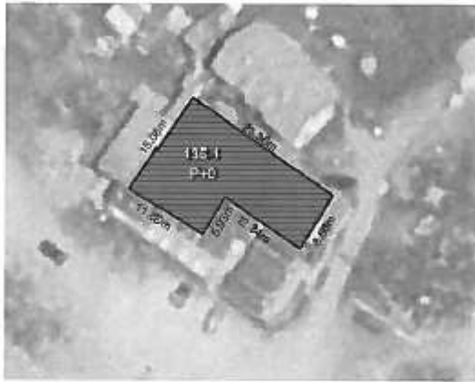
Ortofoto.1 – Paraqitja e gjendjes grafike e ngastrës kadastrale 135-1 si dhe Objekti brenda ngastrës

Sipërfaqja totale sipas gjendjes faktike në terren pjesë e shitjes në këtë Njësi është vetëm sipërfaqja 5=273m 2 që sa edhe figuronë të jetë prona sipas Certifikatës Pronësore.