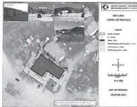
Ortofoto.2 – Paraqitja e gjendjes grafike e ngastrës kadastrale 135-1 dhe Objektit brenda ngastrës në fjalë, si dhe zgjerimet sipas matjeve interne të gjendjes faktike në terren

AGENCIJA KOSOVARE E PRIVATIZIMIT KOSOVSKA AGENCIJA ZA PRIVATIZACIJU PRIVATEIZATION AGENCY OF KOSOVO