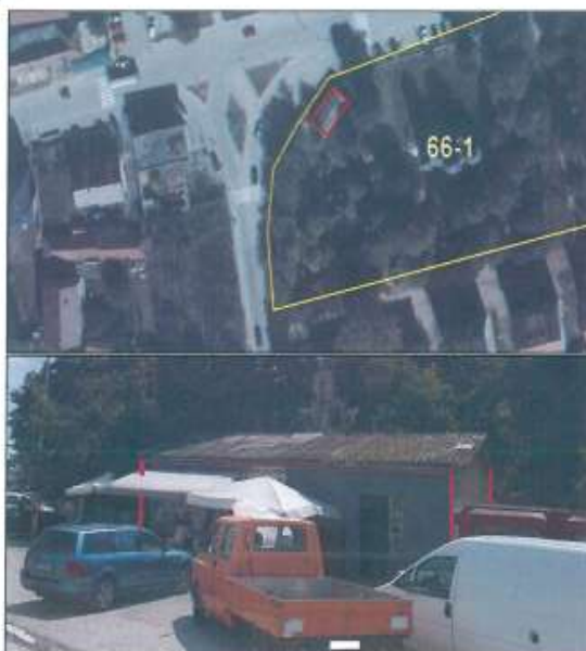
Ortofoto, NSH Produkti- Dyqani në Gjurakoc

Me datë 07.07.2023 zyrtarët e AKP-së vizituan pronën e NSH Produkti, konkretisht dyqanin në Gjurakoc, Komuna e Istogut.