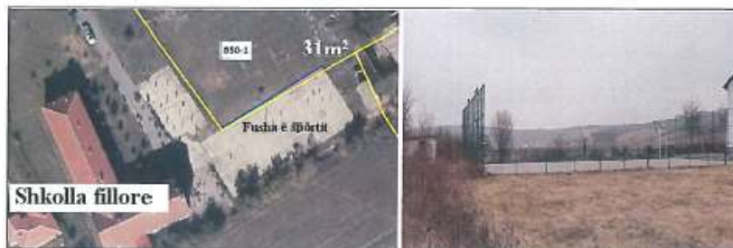
Pamje e pjesës jug-perëndimore e parcelës nr.850-1