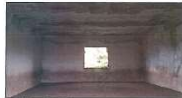
Pamje e Depos në parcelën nr.202-2