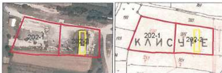
Ortofoto dhe plani kadastral në z.k Kramovik, Komuna e Rahovecit

Depo shtrihet në parcelën nr.202-2 z.k Kramovik.