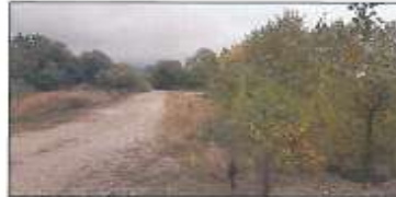
Pamje e parcelës nr.202-1

Duhet cekur se në parcelën nr.202-1 dhe 202-2 z.k Kramovik, ekzistojnë segmente të rrugës fushore.