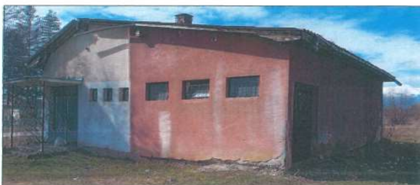
Pamje anësore dhe e pasme e dyqanit në Budisalc, Komuna e Klinës

Gjatë vizitës tonë në terren realizuam matjet me shiritmetër, sipërfaqja e dyqanit rezulton të jetë 109m 2 . Sipërfaqja është prezantuar në detaje në skicën e matjes.