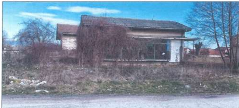
Pamje balllore e dyqanit në Budisalc, Komuna e Klinës

Gjendjen e dyqanit më së miri e prezantojnë fotografitë e mëposhtme :