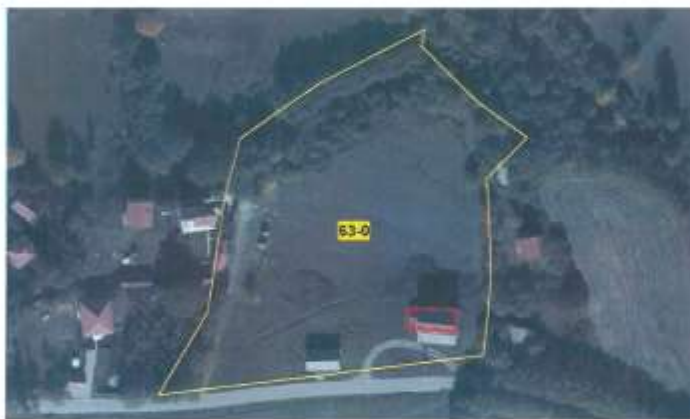
Ortofoto - Objekti (Mulliri) në z.k Brezhtnik, Komuna e Pejës

Objekti shtrihet në parcelën nr.63 z.k Brezhtnik, parcelë kjo që figuron në emër të "PSH E Mirë e Fshatit".