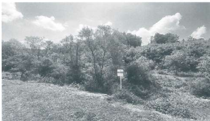
Foto nga parcelat

AGJENCIA KOSOVARE E PRIVATIZIMIT KOSOVSKA AGENCIJA ZA PRIVATIZACIJU PRIVATISATION AGENCY OF KOSOVO