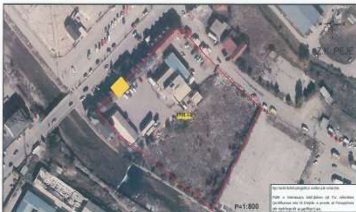
Ortofoto ,pozicioni i shtrirjes së depos

Në bazë të matjeve të realizuara në terren, sipërfaqja(neto) e depos (bodrumit) është = 130m^2 .