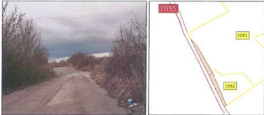
Pamje e rrugaës së asfaltuar brenda parcelave nr.1061 dhe 1062