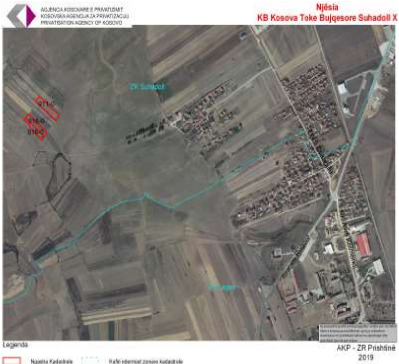
ZZ Kosovo Poljoprivredno Zemljište Suvi Do X – orijentacija od geoportala

Fotofarfija/ fotografije ili drugi podaci o imovini za prodaju