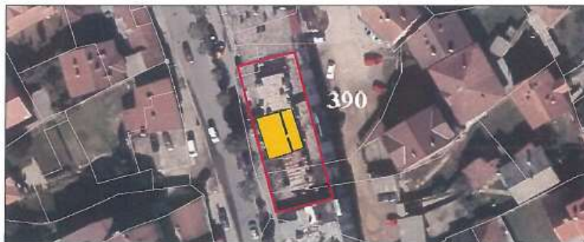
Pamje e dyqanit nr.2 dhe pozicionimi i saj në ortotafoto