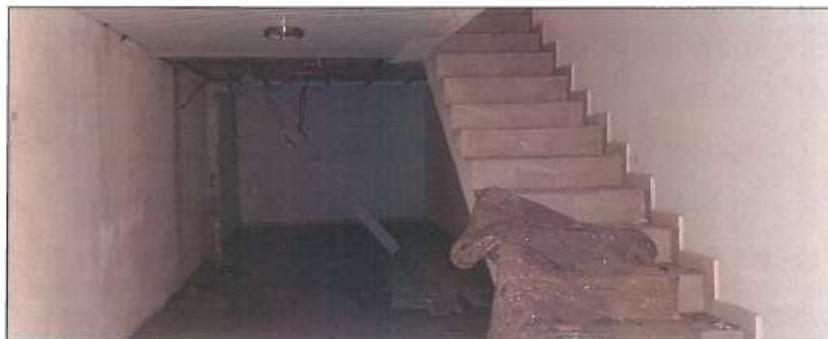
Pamje e bodrumit