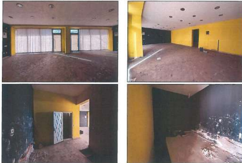
Pamje e katit përdhese

Fotografitë e mëposhtme prezantojnë gjendjen faktike në terren :