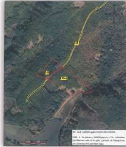
Fig.1 Òrtufoto, parcelat kadastrale 5-0, 139-0

Toka është e regjistruar në certifikatën e pronësisë, parcela kadastrale me nr të njësisë P-70705066-00005-0 me sipërfaqe 3599m 2 me kulturë Mal i klasës 3, P-70705066-00139-0 me sipërfaqe 9313m 2 me kulturë Mal i klasës 3 në vendin e quajtur "M'atane trave-Rracaj", ku sipërfaqja e përgjithshme është 12912m 2 (1 ha 29 ari 12 m 2 ).