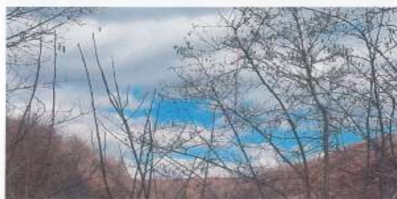
Fig. 2 fotografitë paraqesin gjendjen faktike në terren:

Zyrtare Kadastrale Rajonale: Blerita Jashari Kastrati