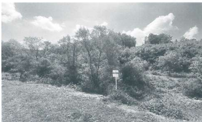
Foto nga parcelat

AGJENCIA KOSOVARE E PRIVATIZIMIT KOSOVSKA AGENCIJA ZA PRIVATIZACIJU PRIVATISATION AGENCY OF KOSOVO