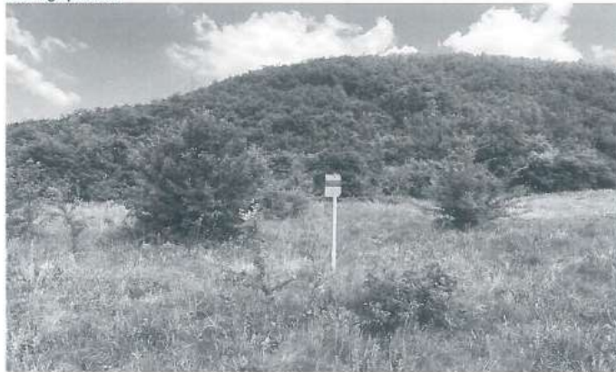
Foto nga parcelat

AGJENCIA KOSOVARE E PRIVATIZIMIT KOSOVSKA AGENCIJA ZA PRIVATIZACIJU PRIVATISATION AGENCY OF KOSOVO