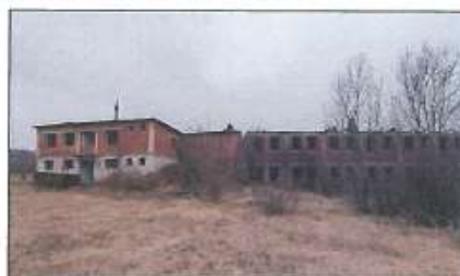
Pamje e objekteve të demoluara (Porta dhe Objekti P+1) me sip. të llogaritura nga ortofototo 1358m 2