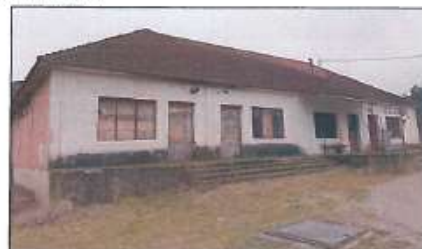
Pamje e objekteve në gjendje relativisht të mirë me sipërfaqe 454m 2