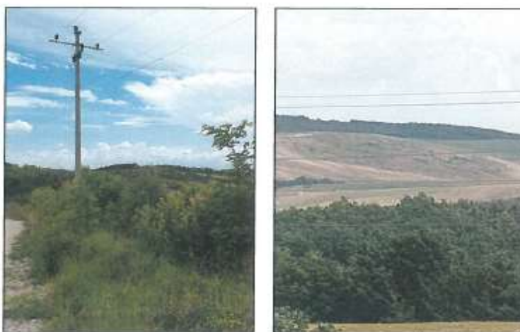
Pamje e parcelës nr.56-30 dhe pamje nga largësia e parcelës nr.56-41 z.k Dranshiq

Fotografia e mëposhtme e realizuar nga largësia prezanton gjendjen e parcelave në z.k Dranshiq: